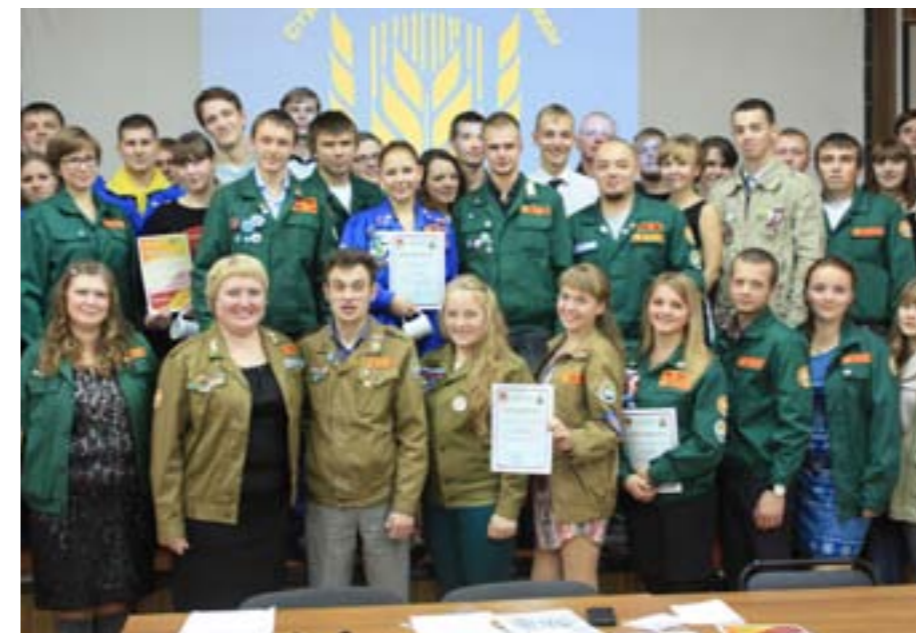
студенческие отряды Академии все в вместе на закрытии