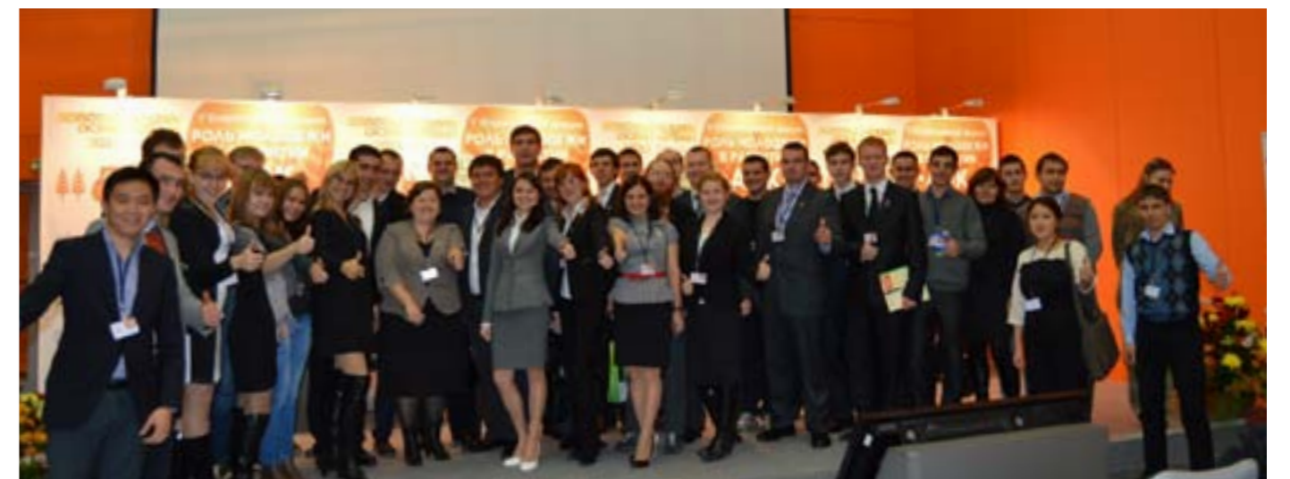
На слете сельской молодежи «Золотая осень»