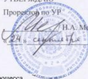
График учебного процесса по основной программе профессионального обучения